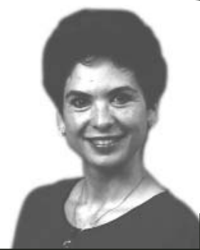
Defensa al Consumidor Defending the Consumer